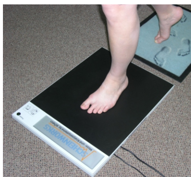
tenzometrická deska Schein cena od 3800 EUR (bez DPH)